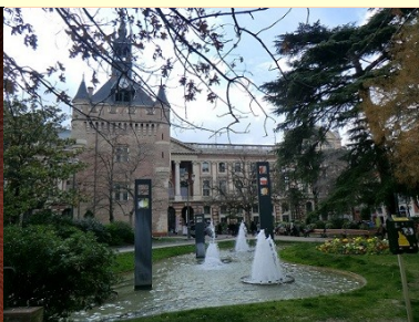
Donjon du Capitole