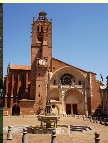
Cathédrale St Etienne