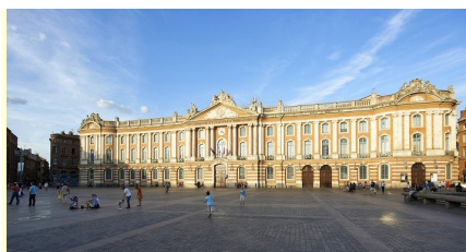
Capitole de Toulouse