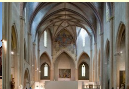
Cloître des Augustins