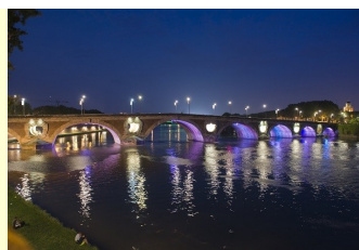
Le pont neuf illuminé