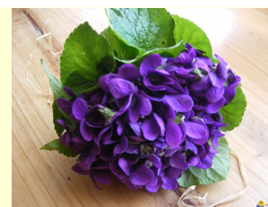
Bouquet de violettes