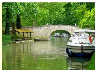
Le Canal du Midi